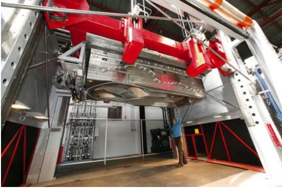
Twin Shuttle Presse bei Benteler-SGL.